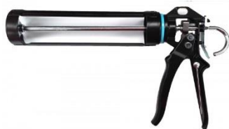
Pistola para masillas alta Viscosidad. Para la aplicación del adhesivo sellador.